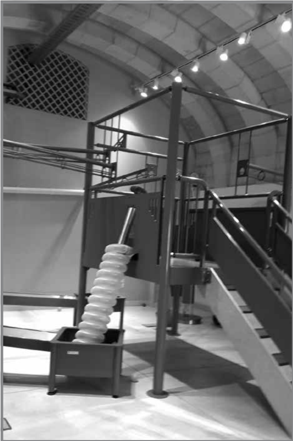
Esebit tat-Tfal biex jilagħbu

Kull sezzjoni hija mibnija b'diversi esebiti differenti li kulhadd jista' jmiddej li hawnhekk huwa impossibbli biex tagħti spjega ta' kollox. Min ried jipprova xi ħaġa u sab xi diffikultajiet, dejjem kien isib lil xi hadd mill-istaff li jfiehmed eżattament