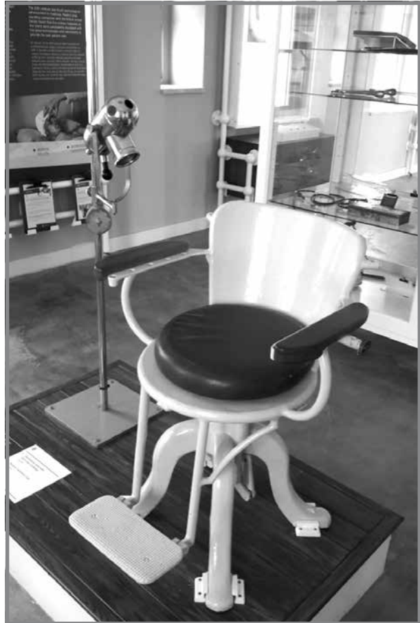
Esebit fl-Isptar Navali